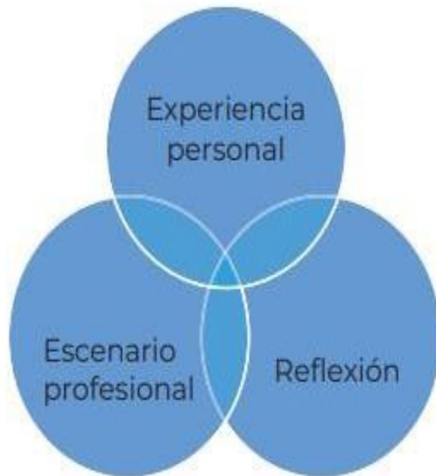
Figura 1. Ejes básicos de la Práctica Reflexiva